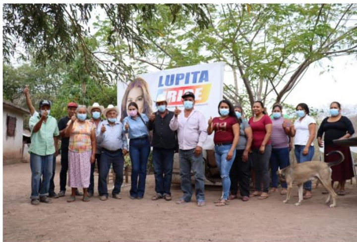
Cómo inmovilizaron a opositores de alianza Morena-PAS