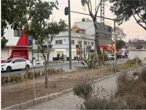
CAMELLÓN DE LA AV 8