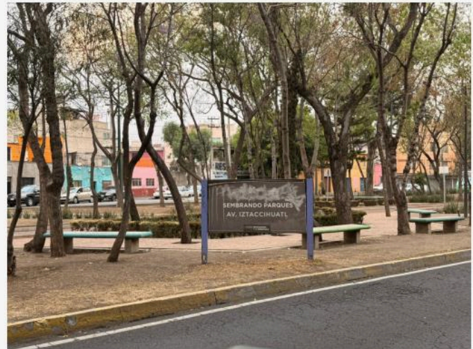
CAMELLÓN DE IZTACCHUALTL