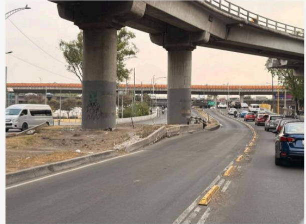
EJE 1 NTE