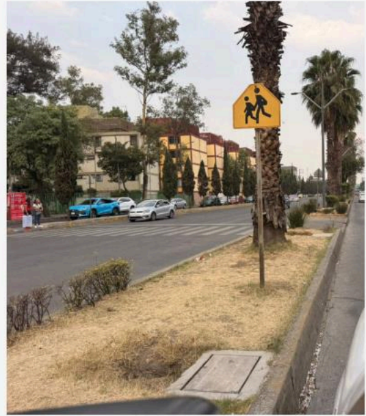
CAMELLÓN DE FRAY SERVANDO