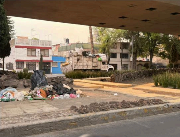
CONGRESO DE LA UNIÓN