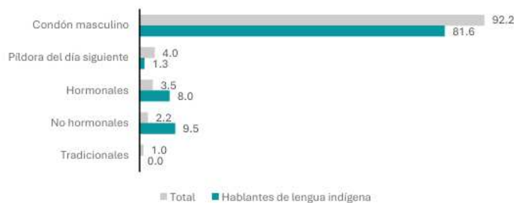
Gráfica 1 Mujeres adolescentes que usaron métodos anticonceptivos en su primera relación sexual, según método utilizado 2023 (distribución porcentual)

Nota: Los porcentajes están calculados sobre el total de mujeres de 15 a 19 años que usaron métodos anticonceptivos en la primera relación sexual, por lo que la suma de los porcentajes es mayor a 100 %, debido a que algunas mujeres reportaron el uso de más de un método.