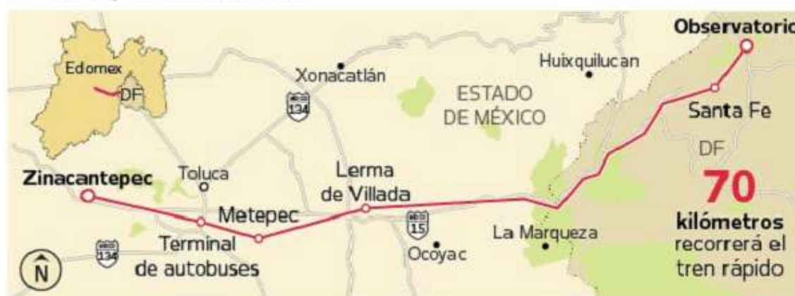
Trazo del Tren Interurbano México-Toluca

https://plumasatomicas.com/noticias/mexico/reprimen-manifestacion-contra-el-tren-interurbano-mexico-toluca/