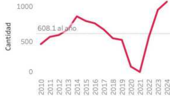
Víctimas de Violencia física en Escuela por edad (2024)