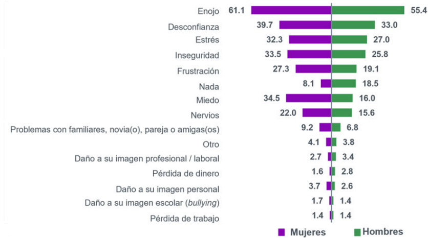
Gráfica 22 Población que vivió ciberacosado, según efecto en la víctima y según sexo 2023 a 2024 1/ (porcentaje)

Nota: La población que se consideró fue la de 12 años y más que utilizó internet en cualquier dispositivo electrónico. 1/ La información se refiere al periodo de julio de 2023 a agosto de 2024.