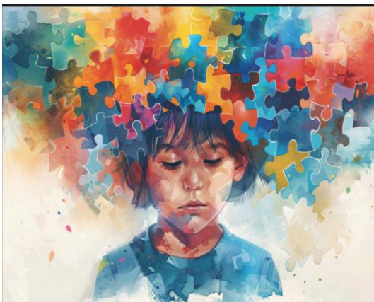
Imagen 1 “Autismo”, en Freepik, www.freepik.autismo , 18 de marzo de 2026.

A nivel internacional, el Día Mundial de la Concienciación sobre el Autismo constituye un llamado a reconocer la importancia y necesidad de construir una sociedad más empática, informada e incluyente, que contemple la diversidad neurológica como un valor esencial dentro del trastorno del espectro autista.