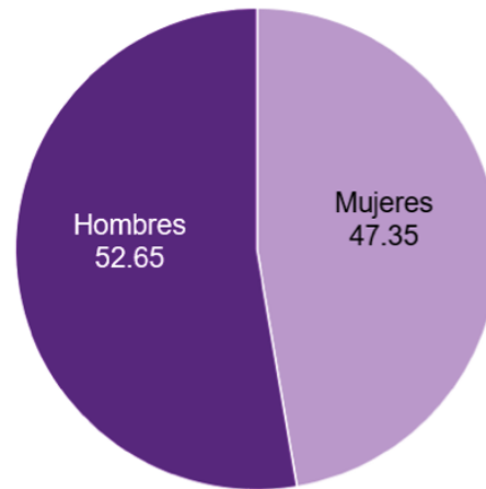
PROPORCIÓN DE ESTABLECIMIENTOS MIPYMES, SEGÚN EL SEXO DE LA PERSONA PROPIETARIA 2023 1/ (porcentaje)

En 2023, se identificó que 4 221 603 mipymes tenían un régimen de capital de persona física. De la cifra anterior, 52.65 % de los establecimientos reportó que un hombre era propietario y 47.35 %, una mujer. 1